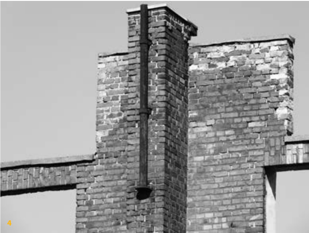
4 Etwa 1,65 m der Mauerkrone wurden bereits abgetragen. Diese Stelle zeigt die alte Höhe an. An der Pfeilervorlage ist die auf einer Platte stehende Hülse zur Aufnahme eines Mastes zu sehen.

Zu beachten sind auf dem bauzeitlichen Foto (s. Kasten) die südseitigen Sitzbänke zwischen den Pfeilervorlagen, auf denen Arbeiter nach harter Arbeit und Anwohner in der Sonne entspannen konnten. Einfach schön diese Vorstellung, wäre dort nicht der Missbrauchsgedanke im Hintergrund, zu vermuten, durch gefühltes gutes Umfeld eine höhere Arbeitsproduktivität bei der Produktion (... von Rüstungsgütern) und mehr Kontrolle der Arbeitnehmer zu erzielen – auch heute ein nicht unbekannter Gedanke. Es handelt sich aber zweifellos um ein ungewöhnliches Bauwerk der Industriearchitektur, das seit 1994 unter Denkmalschutz steht.