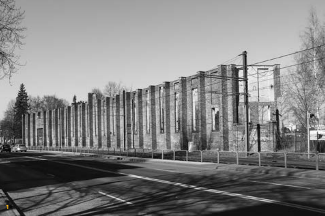
1 Denkmal „Heinkel-Wand“, Zustand 2016: ca. 85 m lang und ca. 9,5 m hoch

Flugzeugkonstrukteur und Unternehmer ein Begriff sein.