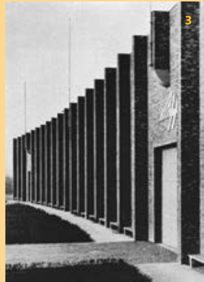
3 Heinkel-Wand nach der Fertigstellung 1936

Die sogenannte Heinkel-Wand wurde 1936 von dem Rostocker Architekten Heinrich Alt in Zusammenhang mit einer Erweiterung dieses Betriebsteiles entworfen und war ganz im Stil der klassischen Moderne gehalten: Sie folgte dem Schwung der Lübecker Straße als langes horizontales Band. Dazu kontrastieren die vorspringenden Pfeilervorlagen und die schmalen hohen Fenster mit der Betonung der Senkrechten. Die Pfeileranordnung ist nicht nur Gestaltung, sie ist statisches Element der Mauer, die als freistehende Wand konzipiert wurde und mehrere Hallen verdeckte. In diesem Betriebsteil wurden Flugzeugteile, vor allem Tragflächen, gefertigt und zur Endmontage zum Hauptwerk nach (Rostock)-Marienehe gebracht. (Quelle: Peter Writschan, Amt für Kultur, Denkmalpflege und Museen Hansestadt Rostock)