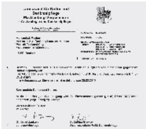
7 Ausriss aus dem Schreiben des Landesdenkmalamtes vom 31. 3. 2015

Unter Berücksichtigung der Gesamtumstände und Interessenlagen der Beteiligten könnte sich