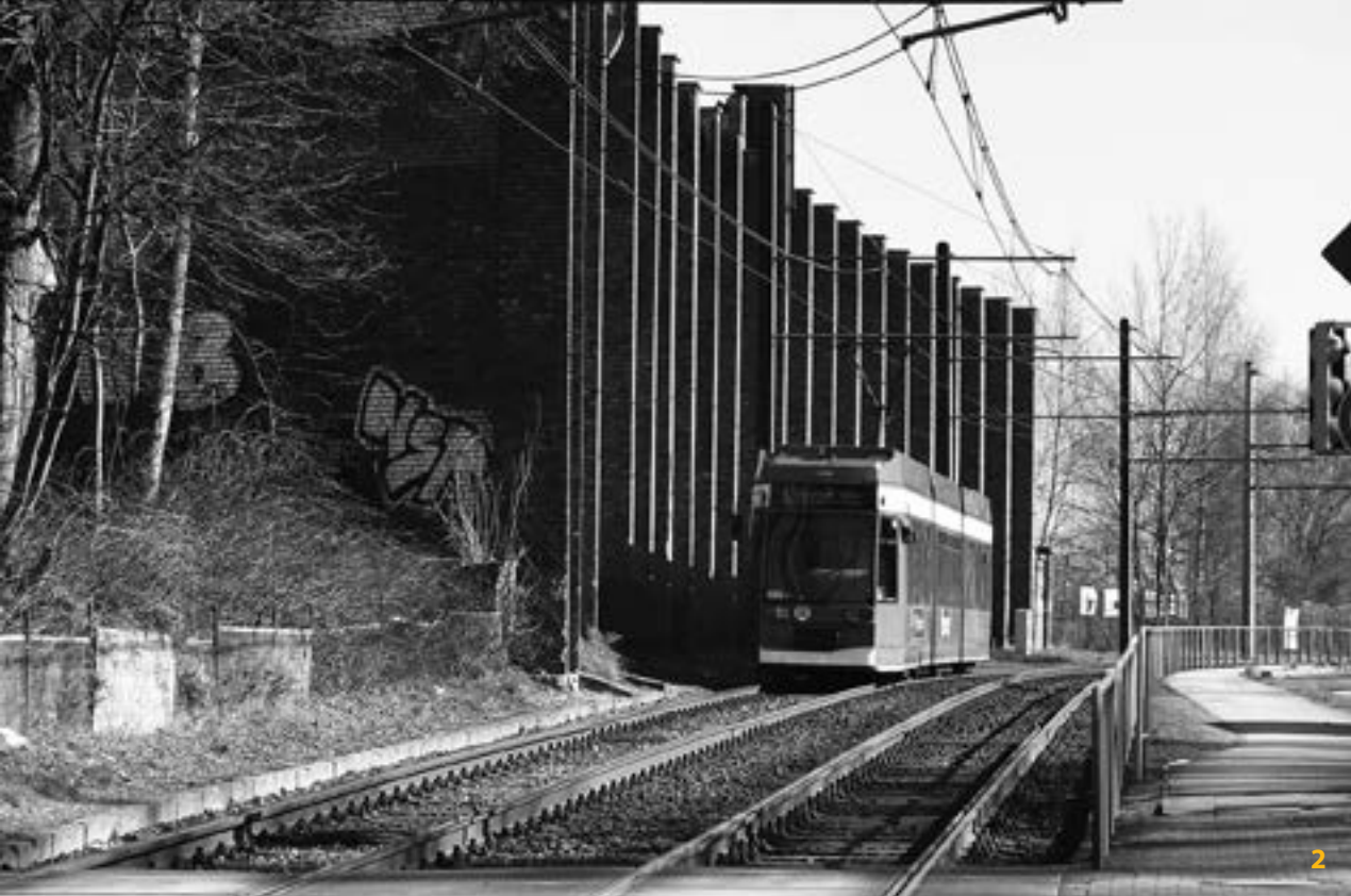
2 Ein Vergleich mit der Straßenbahn verdeutlicht die Dimensionen der Mauer.