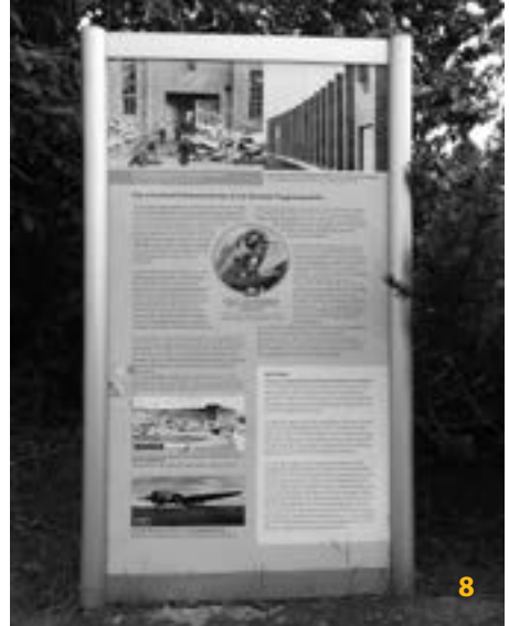
8 Eine der Informationstafeln zur Heinkel-Wand auf der gegenüber liegenden Straßenseite

Diese Mauer stammt aus einer Zeit, in der sie als ein Stück Schönheit dieser Stadt positiv herausragte. Die Mauer erzählt auch von den 12 Jahren Geschichte zwischen 1933 und 1945 – und stellt Fragen nach dem Warum. Der Standort der Mauer ist ein originaler Ort, an dem nicht nur Produktion stattgefunden hat, gut sichtbar und in exponier-