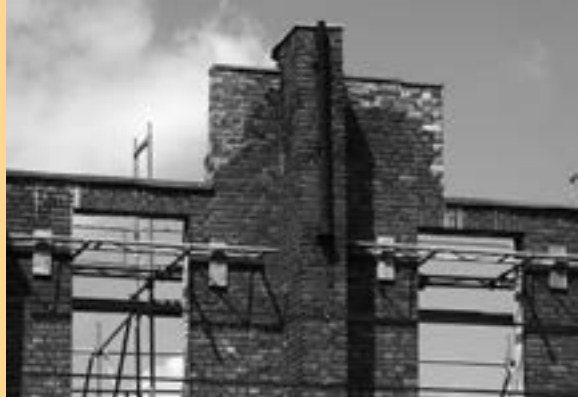
Von der Straßenseite aus lassen sich die Ausmaße des zweireihigen Gerüsts nur mit Mühe erahnen.

An dieser Darstellung darf gezweifelt werden – aus mehreren Gründen: