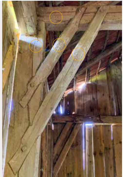
5 Einheitliche Verzimderung von Ständer, (Decken-)Balken und Kopfbändern mit identischen Abbundzeichen (AIIII)