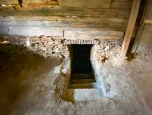
10 Verbindung zu einem Erdkeller oder vielleicht auch Erdstall