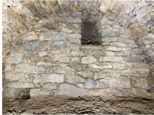
11 Innenansicht der unterirdischen Anlage

dert ihre „Hochblüte“ – wurden aber ab dem 13. Jahrhundert in Bayern wieder verfüllt. Ab ca. 1500 wurden keine Anlagen mehr gebaut. In Bayern setzte sich Karl Schwarzfischer ab 1950/60 ausgiebig mit Erdställen auseinander und gründete 1973 den Arbeitskreis für Erdstallforschung e. V. und erst danach wurden Erdställe gelegentlich auch durch die zuständigen Denkmalpflegebehörden untersucht und die denkmalpflegerische Bedeutung anerkannt.