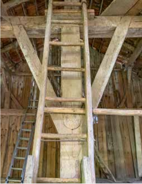
8, 9 Die Bedeutung der Ritzung MW oder MVV konnte bisher nicht geklärt werden