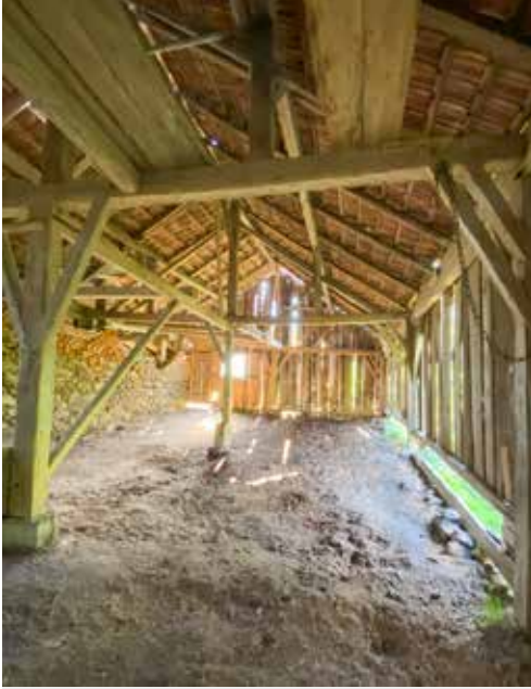
4 Blick in den Stadel