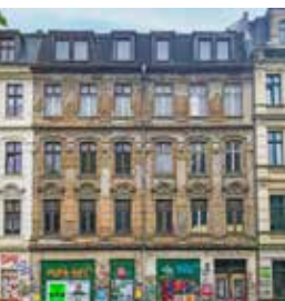
Leipzig, Wolfgang-Heinze-Straße 43

Auf Vorschlag der Unteren Denkmalschutzbehörde wurde die Hofanlage zum Tag des offenen Denkmals 2023 vorgestellt mit Führungen der Kreisheimatpflegerin Cornelia Schink. 🐾