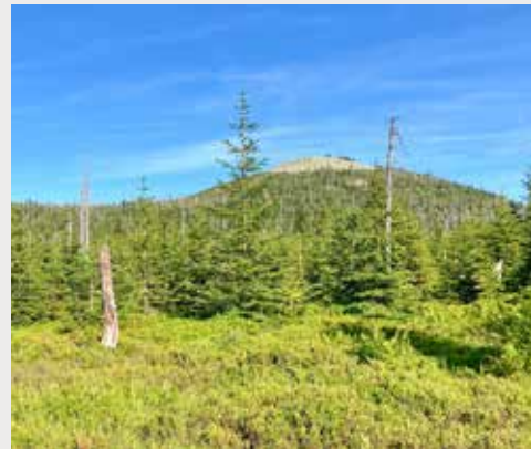
Wilder Wald im Nationalpark Bayerischer Wald: Der Wald verjüngt sich auf natürliche Weise, ohne menschlichen Einfluss, nachdem in den 1990er Jahren viele Fichten durch Borkenkäfer-Aktivitäten abstarben

Im Gegensatz zu Nationalparks stellen Naturparks Landschaftsräume dar, die durch menschliche Eingriffe geprägt wurden und bewirtschaftet werden. Nationalparks sind wie Naturparks großflächig, jedoch hat in Nationalparks der Naturschutz eindeutig Vorrang gegenüber der Nutzung. Die Nutzung wird in Nationalparks größtenteils eingestellt, so wird beispielsweise auf eine forstwirtschaftliche Nutzung (Holzernte) verzichtet.